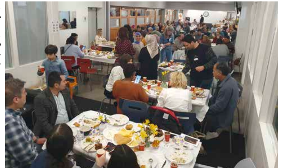
Opstandingskerk Zwolle maart 2025, ontmoetingsmaaltijd moslims en christenen

..... Omgaan met krimp vraagt om samenwerking