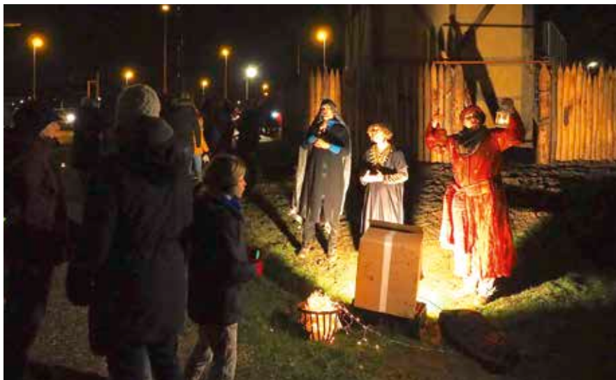
Lichtjesroute Leidsche Rijn