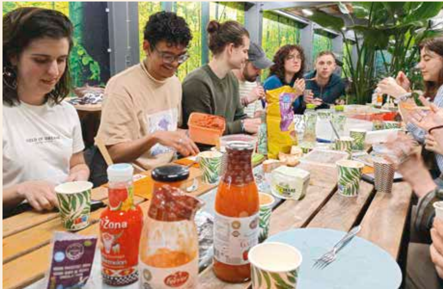
Klimaat-picknick met studenten

door de kerk al bij voorbaat veroordeeld voelt? Is er plaats voor de transgenderstudent en voor de student die niet meer zonder drugs kan? Kan ik ook ruimte geven aan de student met wie ik zelf niet meteen verbinding kan krijgen? Kan ik voorbij de boosheid van een Afrikaanse studente kijken die mijn vriendelijke aanbod als betutteling ziet van een bevoorrecht wit persoon?