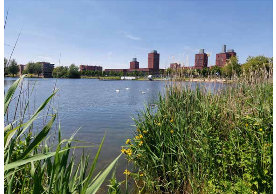
De Vinex-wijk is ruim opgezet met veel water en groen

..... Er zijn overeenkomsten tussen onze doelstellingen en die van de gemeente