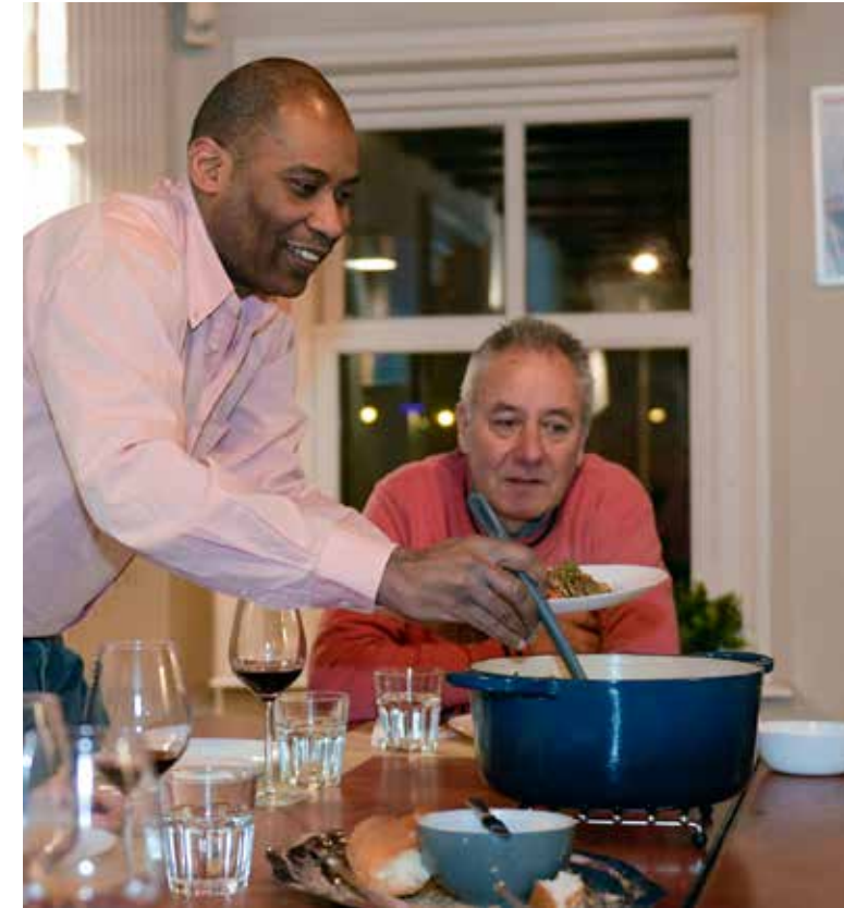
Het door-kauwersdiner van de community TRAAG

lijke projecten in de wijk als onze christelijke roeping. We zien Gods koninkrijk aanwezig op veel plekken waar recht gedaan wordt aan mensen. Wij willen deze projecten als waardevol in zichzelf zien. We zijn helder in onze doelstelling. Voor ons als christenen is ons geloof de drijfveer om mooie dingen waar te maken in onze wijk. We willen niet als geheime agenda een missionaire doelstelling inbrengen. We zijn altijd helder over onze motivatie (de liefde van Christus) en willen laten zien dat we het belangrijk vinden om er voor elkaar te zijn. Wij vinden het belangrijk om in de wijk aanwezig te zijn op een manier die wij misschien diaconaal noemen, maar die de gemeente Den Haag benoemt als welzijn en maatschappelijk betrokken. Daar zijn kansen voor samenwerking. Voor HECHT is een groot netwerk van belang, omdat we wanneer we meer mensen leren kennen, hen ook kunnen uitnodigen voor activiteiten in de andere ringen.