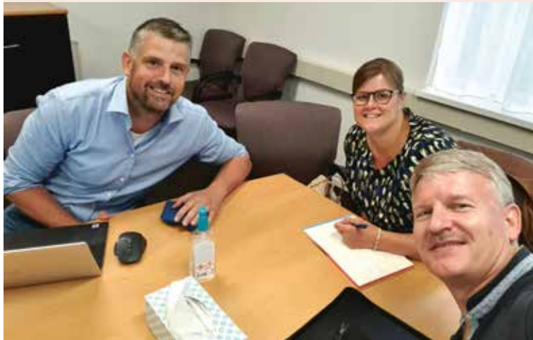
Het bestuur van de Stichting RECHT bij de notaris

HECHT is op dit moment geen kerkgemeenschap, maar valt onder een missionaire stichting. Recent hebben we, naast HECHT, de stichting RECHT Leidschenveen-Ypenburg ( recht-luyp.nl ) opgericht waarmee we maatschappelijke projecten tot bloei van de wijk willen aanjagen en uitvoeren. In onze gemeente, Den Haag, is het niet (altijd) mogelijk om vanuit een stichting (of kerk) met een religieuze doelstelling subsidies aan te vragen. Dit zal bij elke gemeente anders liggen. Om door de gemeente als partner serieus genomen te worden, hebben we daarom een aparte stichting opgericht met een statutaire doelstelling waarin niet wordt verwezen naar het geloof. Het bestuur van HECHT stelt de bestuursleden van stichting RECHT aan. Zo borgen we onze identiteit. Vanuit de stichting RECHT kunnen we nu gemeentelijke subsidies aanvragen.