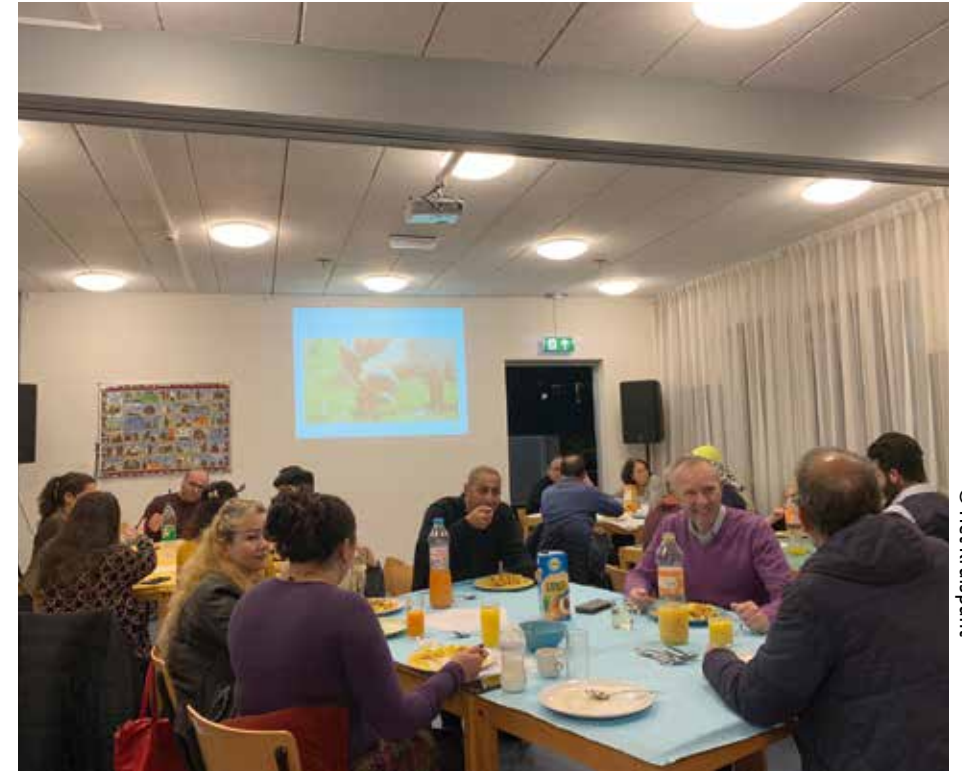
Intercultureel eten bij Bron van Leven

En ook met missionaire organisaties die vaak knowhow en middelen hebben om kerken te versterken. Een deltaplan voor kerken. Niet om de kerken per se in stand te houden, maar om de kandelaar te behouden: drager van licht in een donkere wereld.