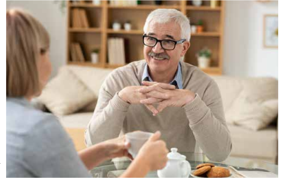
Een gesprek over geld kan ook gaan over: wat doe je met meer dan voldoende, overvloed of luxe?