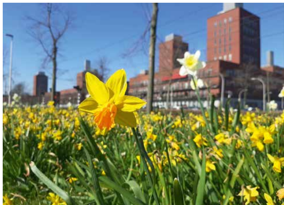
Leidschenvveen-Ypenburg is een prachtige wijk om te wonen

wijk. We schrijven een aanvraag die past bij onze en de gemeentelijke doelstellingen. Wanneer is toegezegd, moet het project uitgevoerd worden zoals toegezegd, waar aansturing voor nodig is. Er is goede verslaglegging nodig, zowel bij het aanvragen als de evaluatie. Er is financieel inzicht nodig. Daar gaat veel tijd in zitten.