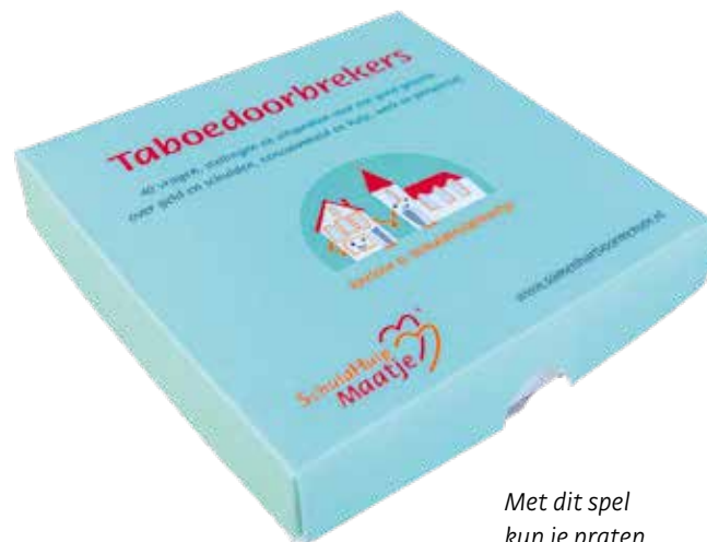
Met dit spel kun je praten over geld