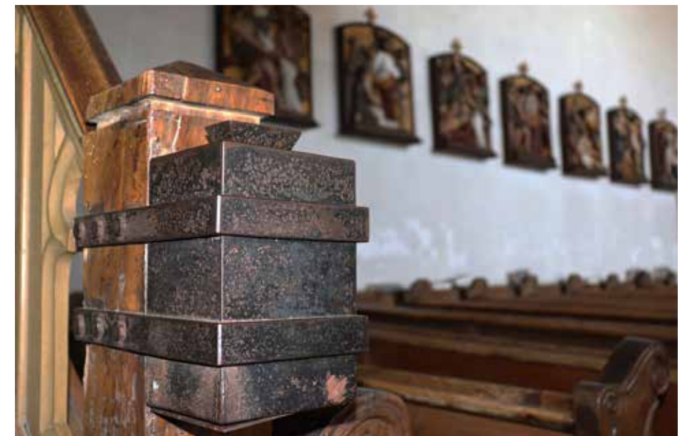
Een oud offerblok: een offer voor de Heer mag iets kosten

Belangrijk werk van de kerk wordt toevertrouwd aan een handjevol mensen