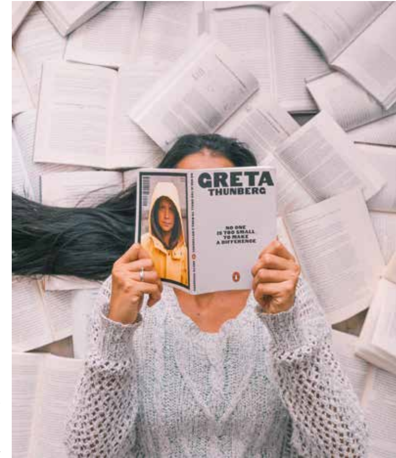
Greta Thunberg is symbool van het jongerenprotest