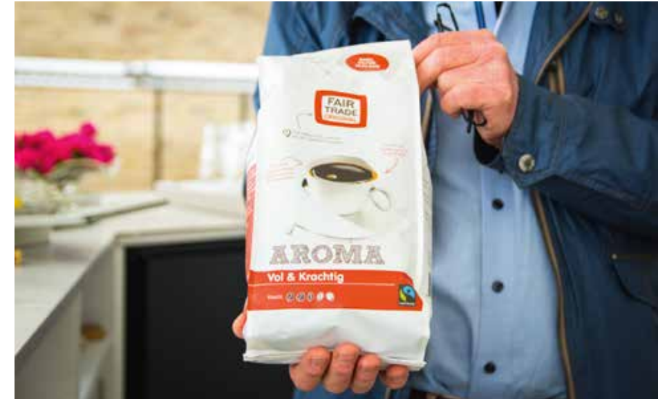
Fairtradekoffie schenken in de kerk

Zes jaar geleden werd de kerk verbouwd, er kwam meer vergader ruimte bij. 'Achter de kerk was een rommelig stukje struiken en bos, dat uitnodigde tot minder frisse praktijken,' vertelt Pellikaan. 'Onze burens hadden last van de bomen die er stonden. In overleg met de gemeente is alles gerooid en legden wij een nieuwe, groene bloementuin aan. Naast nieuw geplante bomen en struiken staan er veel bloeiende planten, waarmee wij een groen baken in de woestijn zijn. Bij het ontwerp hield ik er rekening mee dat het niet te veel onderhoud moest vergen.' Vrijwilligers hielpen bij de aanleg van de tuin, complete gezinnen kwamen helpen. De jeugdclub maakte nestkastjes. De gemeenteleden werden betrokken bij de plannen door voorlichting over de zonnepanelen en doordat het ontwerp van de tuin hun werd voorgelegd. 'De nieuwe aanbouw is zo groen mogelijk geworden; goede dakisolatie, dubbel glas. De bestaande sponningen konden we opnieuw gebruiken. In hergebruik zit de eerste milieuwinst. Het is zonde om goed spul zomaar weg te gooien. Er kwamen twee nieuwe HR-ketels, die een superoude ketel vervingen. Wat nog beter kan, is de afvoer van het hemelwater. Dat gaat nu het riool in, het kan beter de tuin in.'