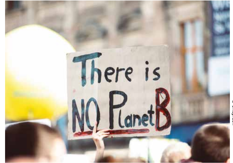
Jongeren realiseren zich dat er iets moet gebeuren: er is geen planeet B

zich grote zorgen maakt over klimaatverandering. Ze vinden het belangrijk dat er in de kerk veel vaker en praktischer wordt gesproken over klimaatverandering en milieuvuiling. Christenen moeten worden opgeroepen om mee te doen aan verandering van leefstijl. Door erover te preken, erom te bidden, er samen (open) over na te denken en vooral iets te doen! Daarbij helpt het wanneer een realistisch beeld wordt geschetst van de situatie en de gevolgen van keuzes inzichtelijk worden gemaakt. Jongeren hebben behoefte aan concrete tips. De nummers van Eilish en Froukje kunnen namelijk ook verlamdend werken.