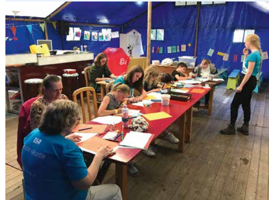
E&R in actie in Bussum (zomer 2020)

In al die jaren hebben honderden E&R-vrijwilligers meegedraaid in een van de lokale projecten in het land, op campings en in buurten. Om dit zomerse evangelisatiewerk een nieuwe boost te geven, hebben E&R, Kerkpunt en Verre Naasten de handen ineengeslagen. Vanuit het verlangen dat meer mensen Gods liefde gaan ontdekken. De samenwerking met Kerkpunt en Verre Naasten betekent een nieuwe impuls voor het E&R-werk. Binnen deze nieuwe samenwerking is Kerkpunt verantwoordelijk voor de toerusting van de E&R-vrijwilligers en het inspireren van lokale kerken, om via missionaire (buurt)projecten voorproefjes te zijn van het koninkrijk van God. Verre Naasten hoopt met deze samenwerking te bereiken dat kerkleden meer mogelijkheden ontdekken om missionair de handen uit de mouwen te steken. Nieuwsgierig wat E&R in jouw buurt kan betekenen? Neem gerust contact met ons op om de mogelijkheden te verkennen. Stuur een mail naar info@kerkpunt.nl .