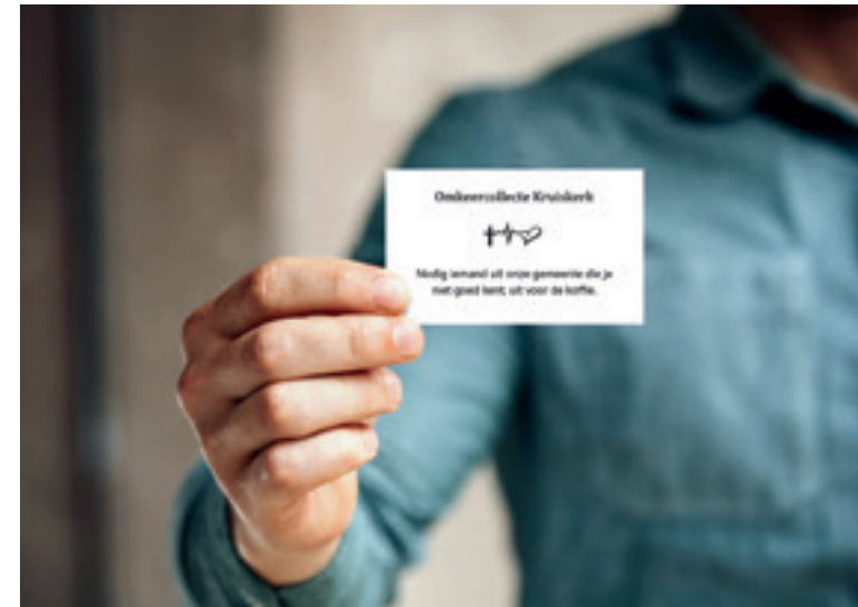
Een omkeercollecte: pak een kaartje met een uitdaging uit de collectezak

Een herkenbaar moment, goede informatie, een duidelijke verbinding met het gebed en een lied; het zijn suggesties die kunnen helpen om de inzameling van de gaven meer tot haar recht te laten komen. Heb je nog andere suggesties? Laat het vooral weten! Want we delen graag mooie voorbeelden uit de praktijk. Mail je suggesties naar info@kerkpunt.nl .