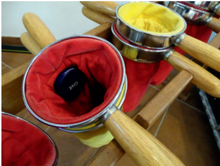
De collectezak wordt steeds meer gecombineerd met een collecteapp

Natuurlijk is goede voorlichting aan de gemeente door de diakenen belangrijk. Vaak kan er meer gedaan worden aan het informeren over de collectedoelen. Via de kerkenapps zijn daar allerlei mogelijkheden voor. En natuurlijk via het kerkblad, de nieuwsbrief en de website van de kerk. En vergeet niet om achteraf ook de opbrengst van de collecte te melden en bij voorkeur ook wat ermee gedaan wordt bij een plaatselijk doel.