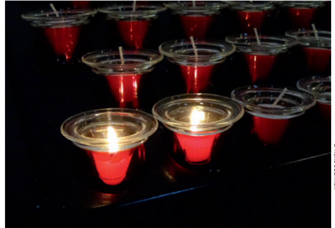
Stilstaan bij de mensen die aan het coronavirus zijn overleden

Niemand weet wanneer dit over is en waar we nog (pijnlijk) door verrast gaan worden