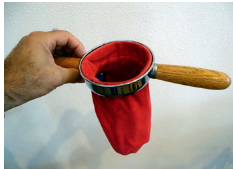
Je gift is een tastbare en zichtbare uiting van een leven in dankbaarheid

Onze collecte staat behoorlijk ver af van de oorspronkelijke vorm, waarbij gemeenteleden gaven meenamen voor de gezamenlijke (liefde)maaltijd en het avondmaal. Daarvan werd ook uitgedeeld aan armen en behoeftigen. Die directe link tussen geven en uitdelen aan hen die het nodig hebben, is bij ons veel minder sterk. Bijvoorbeeld doordat er behalve voor de VVB ook regelmatig nog wordt gecollecteerd voor allerlei kerkelijke onkosten. Ook het gebruik van collectemunten of -bonnen vergroot de afstand tussen geven en uitdelen. Het echte geven gebeurt dan namelijk op het moment dat de collectebonnen worden aangeschaft. Op het moment van de collecte zelf voel je er niets van. En zelfs de collecte voor de diaconie komt vaak terecht op een toch al goedgevulde bankrekening.