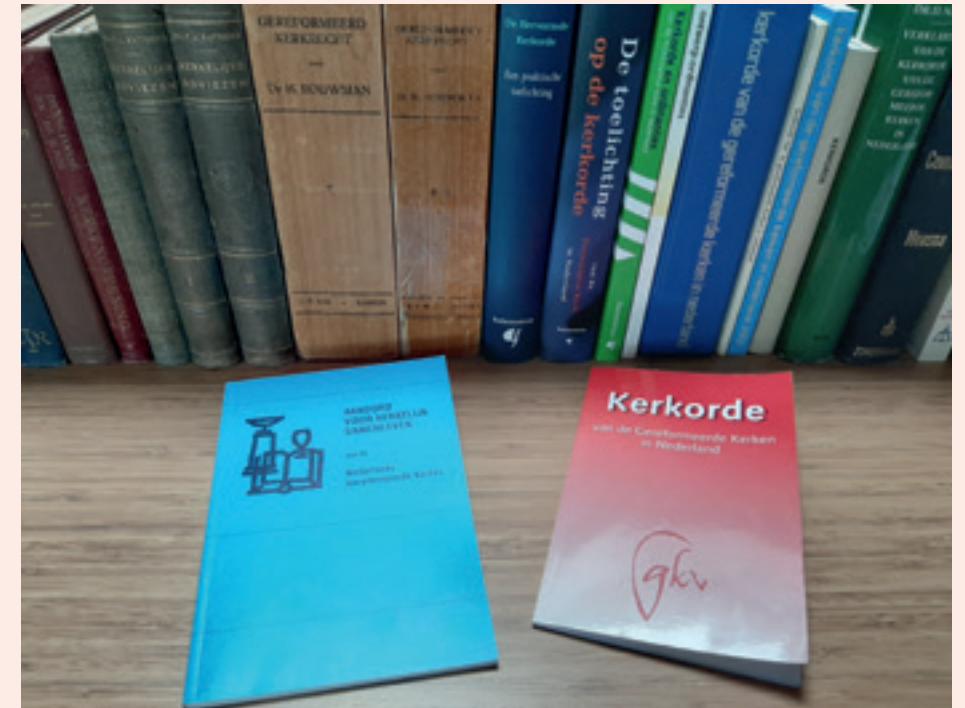
Onze kerkordes maken deel uit van het statuut, zoals bedoeld in het Burgerlijk Wetboek

Ik benadruk dat een plaatselijk statuut niet in de plaats komt van de kerkorde. In geval van strijdigheid van een bepaling in het plaatselijke statuut met een bindende regeling in de kerkorde gaat die laatste voor. Van belang is daarbij dat bepalingen in de kerkorde bindend zijn, tenzij uit de tekst of de toelichting het tegendeel blijkt. Daarom is het goed om in de inleiding van het statuut met zoveel woorden naar die kerkorde te verwijzen. U denkt misschien: strijdigheid met de kerkorde, dat kun je bij het opstellen van het statuut toch voorkomen? Het antwoord is: idealiter kan dat en moet dat. Maar er kunnen zich altijd onvoorziene grensgevallen en interpretatiekwesaties voordoen en bovendien wordt een kerkorde (of een op basis van die kerkorde bestaande landelijke regeling) van tijd tot tijd op onderdelen gewijzigd, waarna er alsnog strijdigheid kan ontstaan.