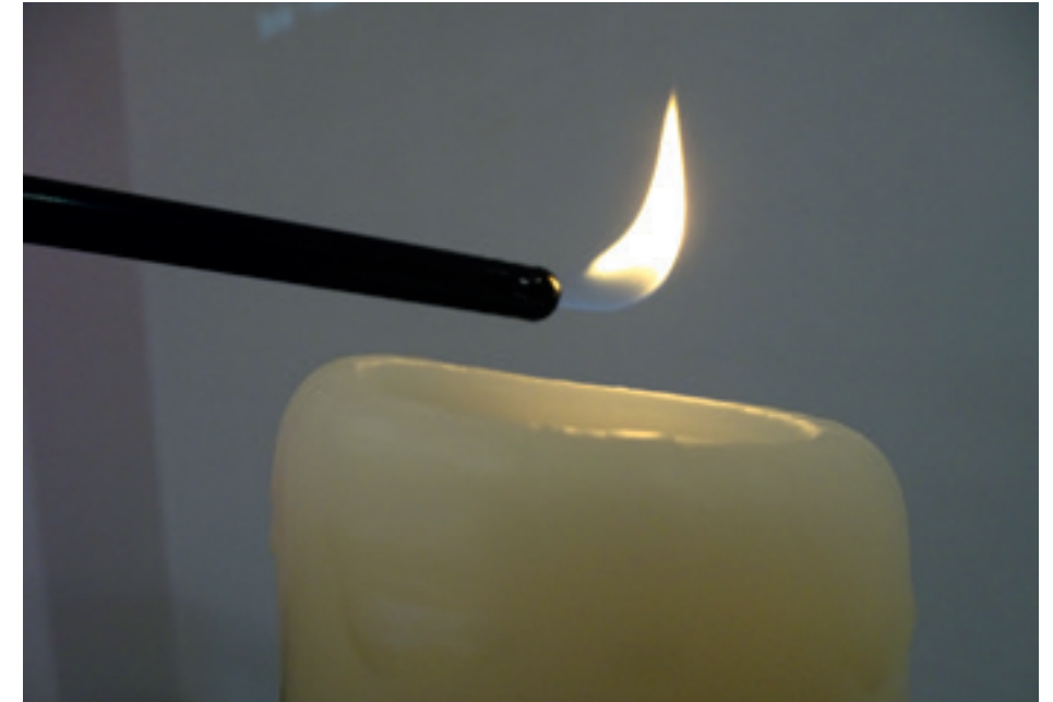
Steek een kaars aan als symbool van Gods aanwezigheid

Liturgie draait om samenkomen. Het is als een driehoeksverhouding tussen God en mij en de gemeente. Je ontmoet God, je ontmoet elkaar en in de ander ontdek je iets van God als de Ander. Daarin is een thuisviering niet anders. Het is een ontmoeting tussen God en jou, waar je een derde aan toevoegt: je partner, gezin, gemeentelid, buur of vriend(in). Thuis je geloof vieren houdt in dat je ruimte creëert en tijd maakt voor een samenkomen met God en anderen, op een ontspannen en intieme manier die past bij de setting van een woonkamer.