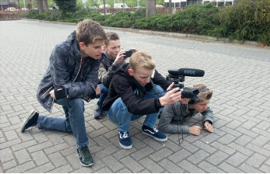
DurfteFilmen in actie